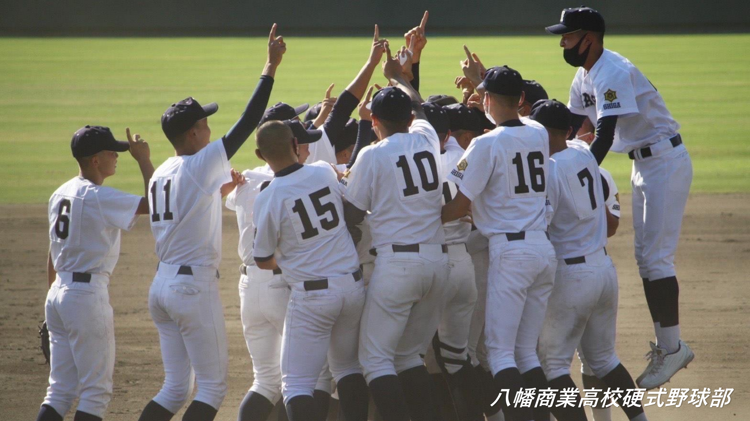
八幡商業高校硬式野球部